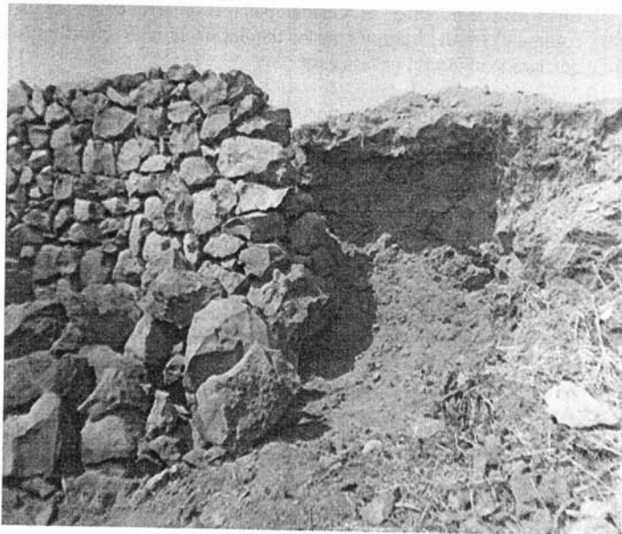
Barda levantada con piedra para delimitar una propiedad ejidal. Nótese al fondo los estratos arqueológicos de un basamento prehispánico.

En alguna ocasión me platicaron que los niños estaban atentos al camino de terracería y en cuanto veían aparecer los carros de los gringos de inmediato se corría la voz: "hay vienen los "moneros", hay vienen los "moneros" y todo aquel que había juntado monitos salía con su bolsita a ofrecerlos.