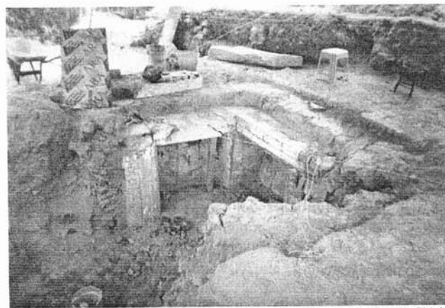
Tumba cruciforme de bóveda. Horizonte Clásico.

.- Solicitar y gestionar la Declaratoria de Zona de Monumentos Arqueológicos la ladera este del cerro de La Mesa por parte del Ejecutivo, desde la parte del área del panteón conocida como “La Rinconada” y hasta el sitio conocido como “la marranera”.