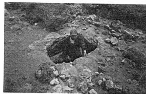
Persona haciendo un Pozo de saqueo en una Unidad de excavación.

Para este momento el patrimonio monumental prácticamente ha desaparecido, ya no hay pirámides visibles, las terrazas y las escaleras de "la Moctezuma" son desmontadas y desaparecen; muchos entierros, los que estaban más encima, cerca de la superficie, son destruidos y sus ofrendas rotas o saqueadas, y las minas de piedra, las canteras, van destruyendo incluso lo que se halla enterrado muy abajo.