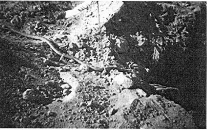
Culebra deslizándose por una unidad de excavación. Proyecto arqueológico Xico 2004-05

En el siguiente capítulo se exponen los datos de los hallazgos más importantes realizados por el proyecto de salvamento y la necesidad de luchar por evitar su destrucción.