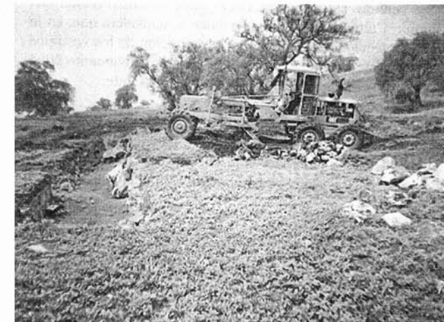
Máquinas trabajando sobre un basamento piramidal. 2005.

.- Solicitar ante las autoridades del INAH que las piezas arqueológicas recuperadas durante la realización del Proyecto Xico 2004 – 2005 no sean retiradas de su lugar de origen (Xico) y sean depositadas para su resguardo en el Museo Comunitario del Valle de Xico para que realicen una función de elementos educadores de la dinámica cultural del lugar.