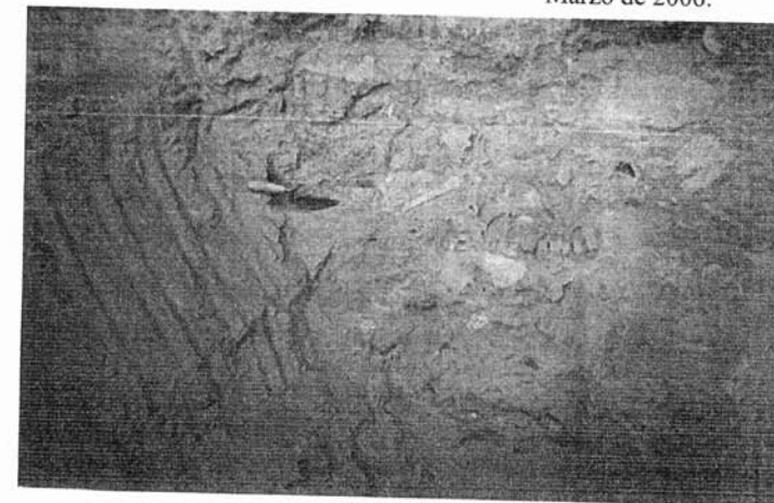
Restos óseos de un entierro prehispánico en el perfil de una zanja abierta por una excavadora.