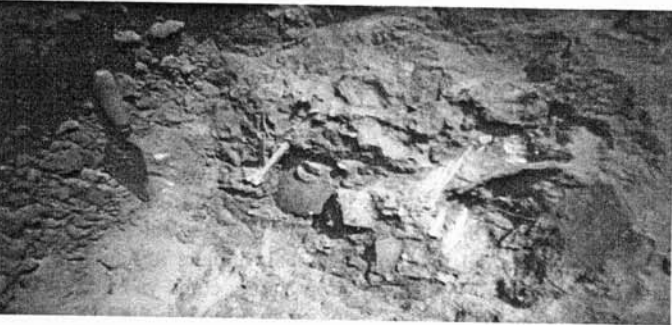
Vestigios arqueológicos destruidos por las máquinas. Proyecto habitacional Real de San Martí. 2005

Pero esta amenaza es mayor, es total. Los árboles son derribados, toda la superficie del cerro es barrida en hasta dos metros de profundidad por las máquinas que abren los cajones para las calles, las zanjas para instalar la red de drenaje y agua potable y no se salva nada: muros de piedra son dismantelados y las piedras careadas diseminadas, los pisos de estuco levantados y desaparecen huellas de patios, banquetas y unidades habitacionales; vasijas de barro pulverizadas y objetos de piedra mutilados, restos óseos de animales y de humanos son dispersados por doquier y los huesos ruedan por la tierra blanqueándose al sol; entierros completos con sus ofrendas, vestigios de viviendas, lo que quedaba de las plataformas, pirámides y terrazas, todo es destruido, desarticulado por la fuerza demoledora de las potentes máquinas.