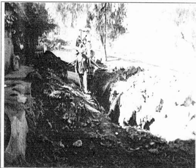
Trabajadores de ODAPAS destruyendo Una plataforma prehispánica. 2000.